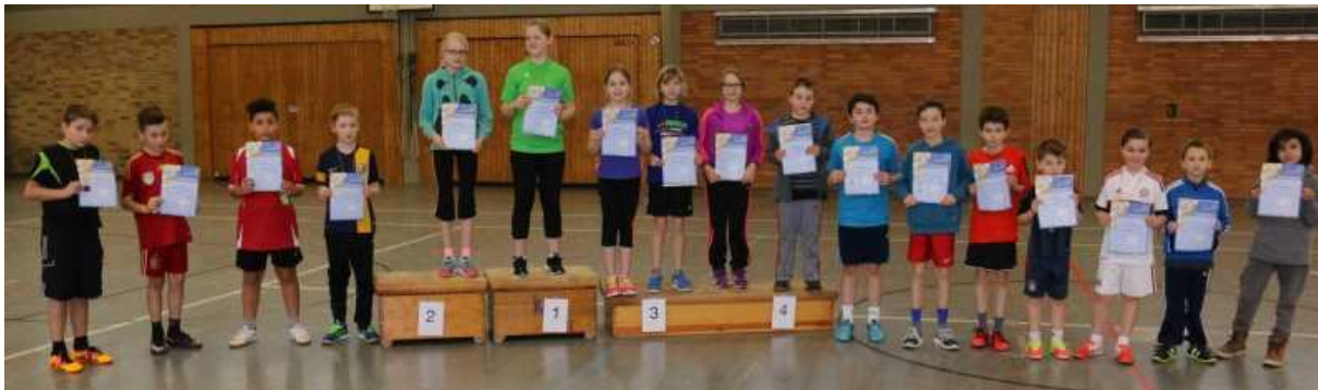
Sieger und Platzierte

Alle erhielten eine Einladung für den Bezirksentscheid.