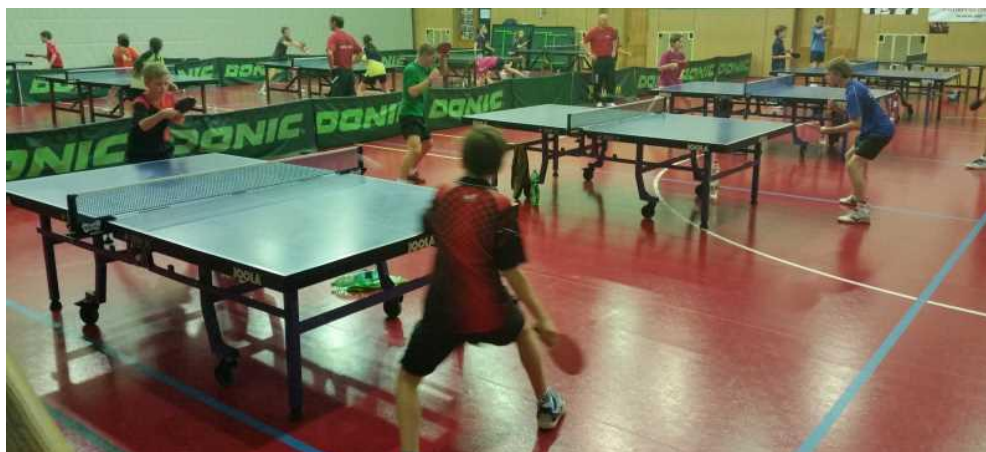
Impressionen aus der Lehrgangshalle in Vlasim